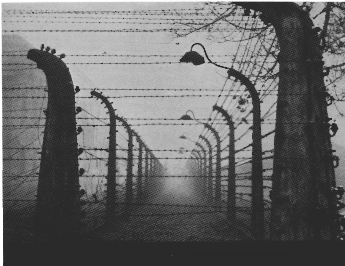
Il reticolato di Auschwitz, in Polonia, dove furono deportate le donne leccesi.

Il suo cadavere venne ritrovato fra quelli dei martiri di Fossoli, fucilati nel luglio 1944.